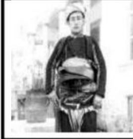
YÖRÜK ALİ EFE